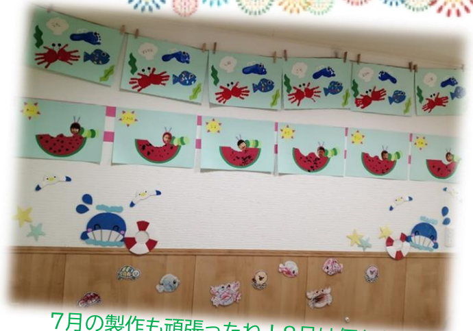
7月の製作も頑張ったね！8月は何か？