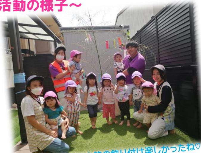
七夕！夏祭り！笹の飾り付け楽しかったね！