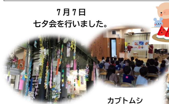
カブトムシ ももちゃん じんくん